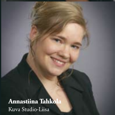
Annastiina Tahkola